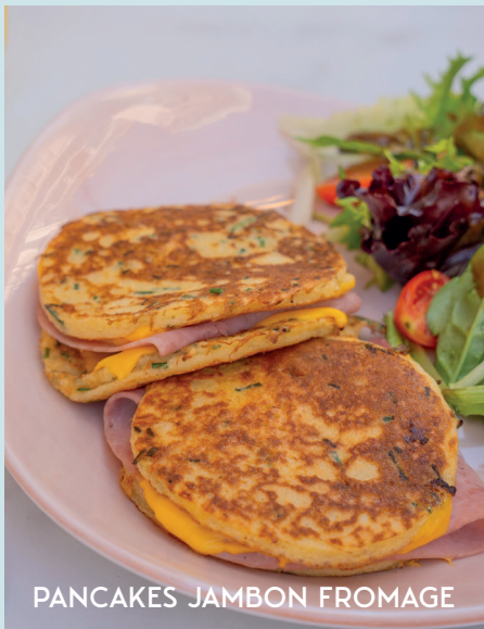
PANCAKES JAMBON FROMAGE

Tous nos pancakes salés sont accompagnés de salade verte et tomates cerises