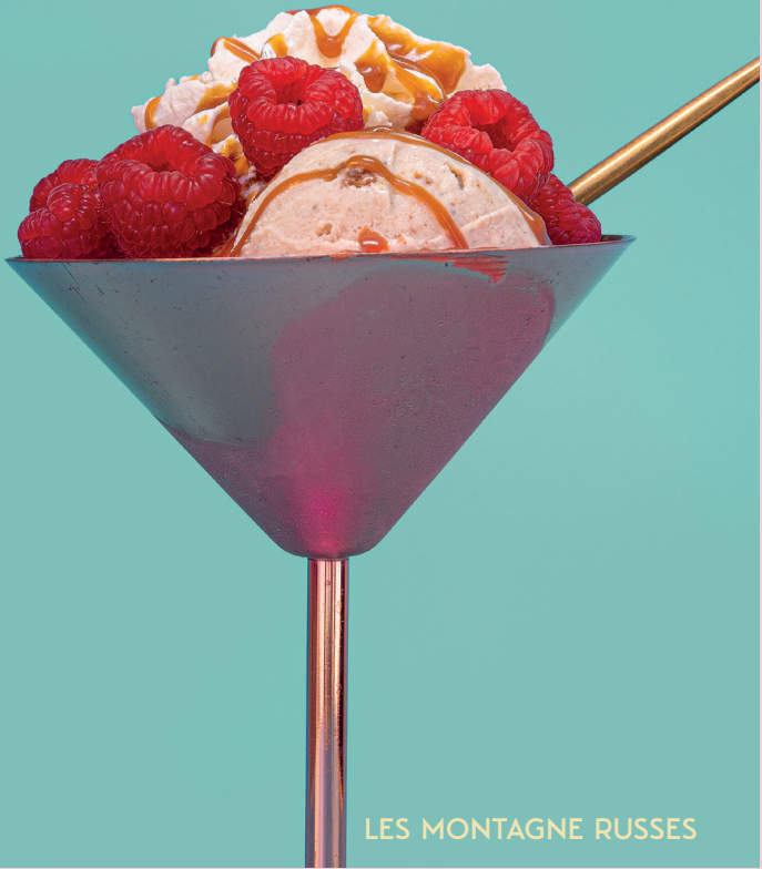
LES MONTAGNE RUSSES