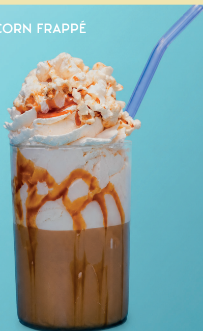
LATTE POP-CORN FRAPPÉ