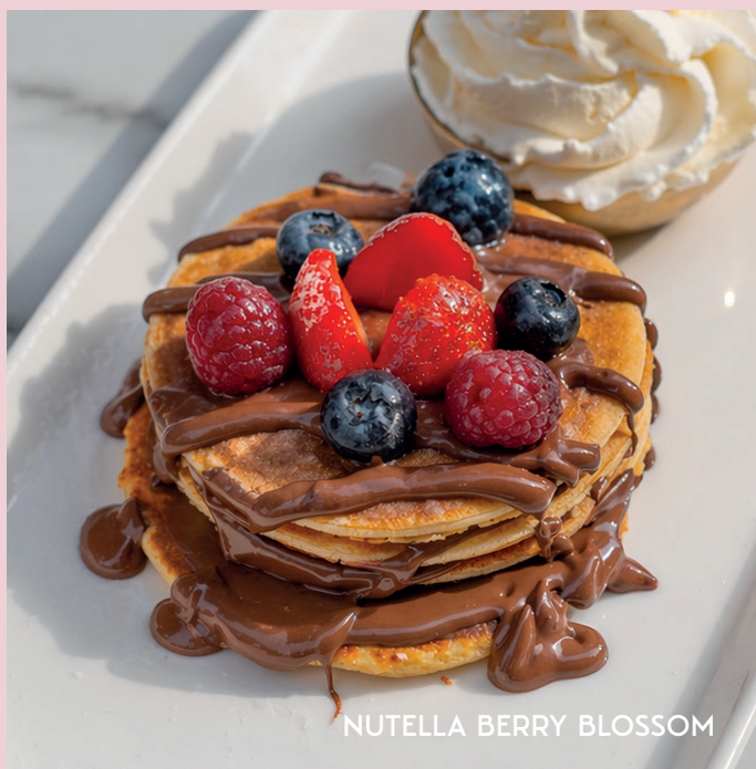
NUTELLA BERRY BLOSSOM