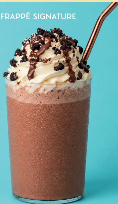
CHOCOLAT FRAPPÉ SIGNATURE