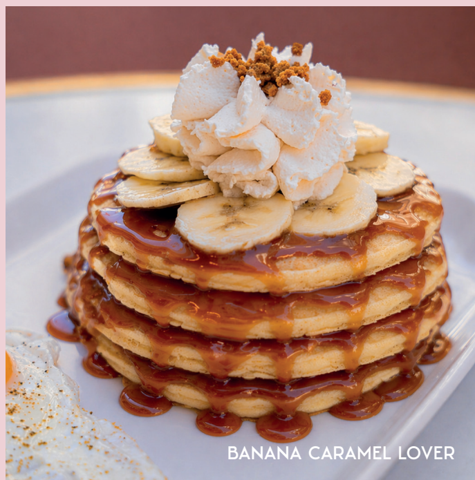
BANANA CARAMEL LOVER