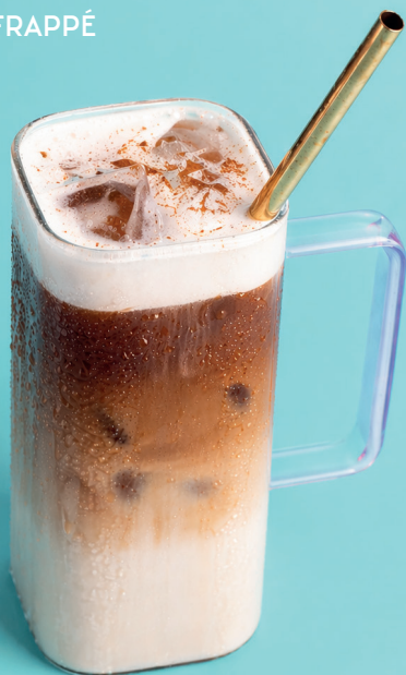
CAFÉ LATTE FRAPPÉ