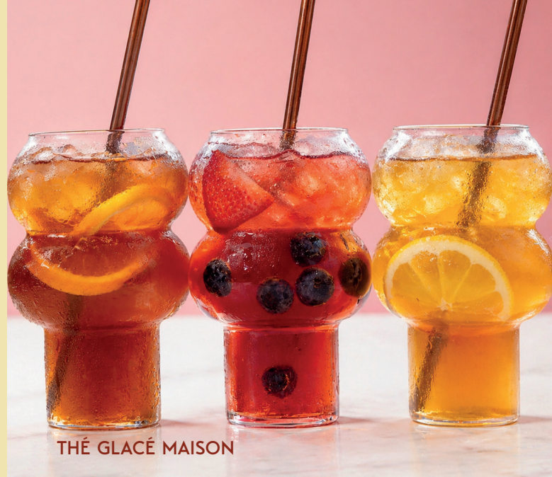
THÉ GLACÉ MAISON